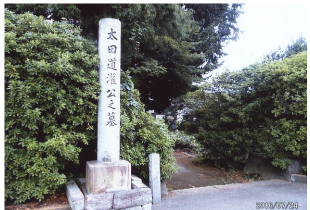
※本堂の手前にある「太田道灌公之墓」で奥にいろいろと資料や石遺跡などがある。