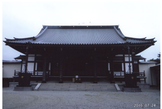
※洞昌院の本堂、かなり大型の本堂である。