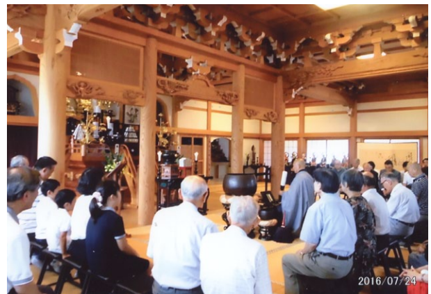
※本堂の中の法要風景、立派な本堂の中であった。

晩年は、山内上杉家と扇谷上杉家との争いに巻き込まれ、1486年(文明18年)7月26日、その才能を恐れ