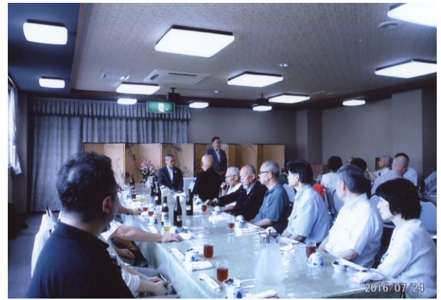
※懇親会の会場風景、太田さんの名前が多かった。

のちに、関東は「北条早雲」によって攻められ、早雲の孫「氏康」によって扇谷上杉家は滅ぼされた。