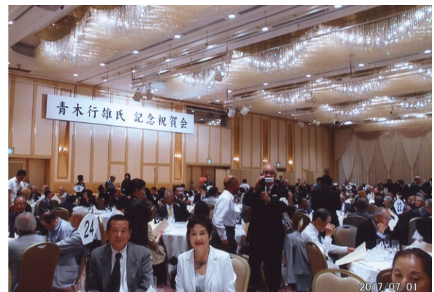
※約400名参加者の明治記念館「富士の間」会場風景