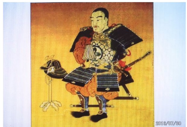
※ありし日の道灌公で、12代目(?)の方が書いたと言われる画、本堂の奥に飾られていた。