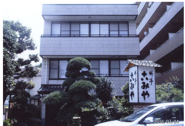
※法要の後の懇親会の会場。