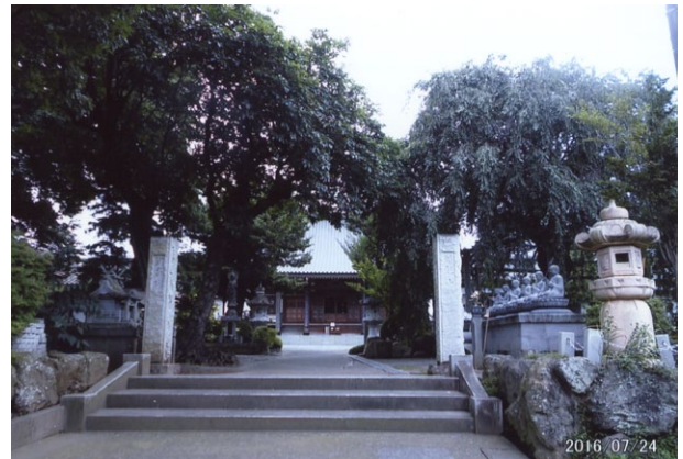
※洞昌院の表玄関の入口、両側の石柱には左側に蟠龍山・右側に洞昌院の文字が彫られている。

道灌公は1432年(永享4年)相模に生まれた。幼名を鶴千代と言いその才は衆に超えていた。父の太田資清入道道真は武州川越の城主で文武の道に長じ、連歌の巨匠、心敬僧都や宗祇法師とも親交があった。父の道真は吾が子が己れの才に溺れることを恐れ9歳の時に鎌倉建長寺に托し、衆僧とともに勉学参禅の道に入らしめた。道灌13歳の時はすでに父道真の名に恥じない程の成長ぶりであったという。成人して資長を名乗ったが関東管領上杉持朝は深くその才