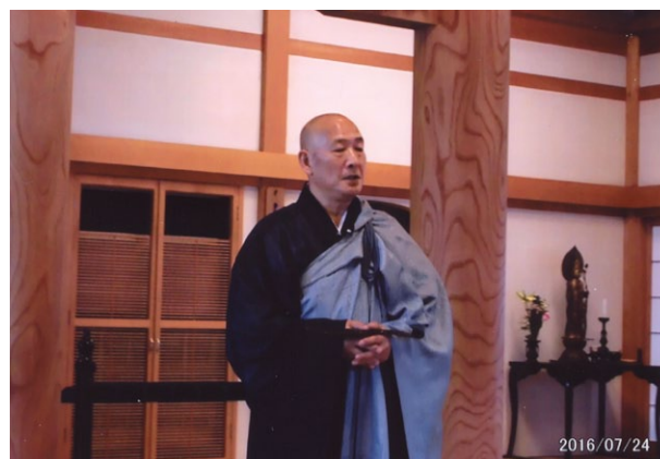
※洞昌院の住職、法要の前の挨拶。