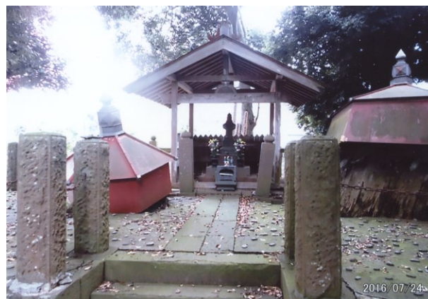
※道灌の墓と書かれた奥にある墓、長い歴史を物語っている。